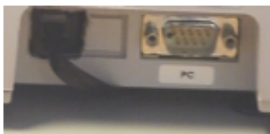
PUERTOS CAJON Y PC